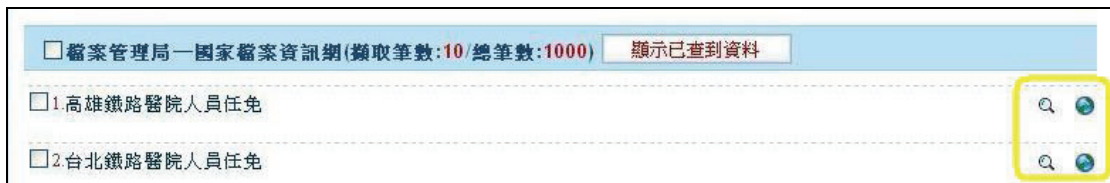
圖 9 延伸查詢與連結原始資料庫

在查詢結果出現後，點按右方「放大鏡」圖示，可將查詢中的檔案名稱及主題，連結至其他資源進行延伸查詢；點按「地球」圖示，可以連回原始資料庫進行相關資料查詢（如圖 9）。