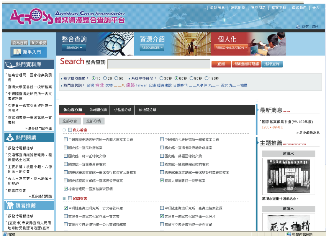
圖 1 ACROSS 首頁

為便捷使用者搜尋典藏於檔案館、圖書館及博物館等之檔案資源，檔案管理局(以下簡稱本局)於民國 98 年完成建置「檔案資源整合查詢平台」(Archives Cross boundaries, 簡稱 ACROSS, 網址 http://across.archives.gov.tw ) (如圖 1), 將政府機關、民間團體處理業務產生之紀錄, 以及由家庭或個人產生之私人紀錄進行整合。初期先以政府機關典藏之文書、圖像及照片資料為主, 共 11 個機關 29 個資料庫, 後續逐步擴大至影音、樂譜及電子文獻等其他類型檔案。