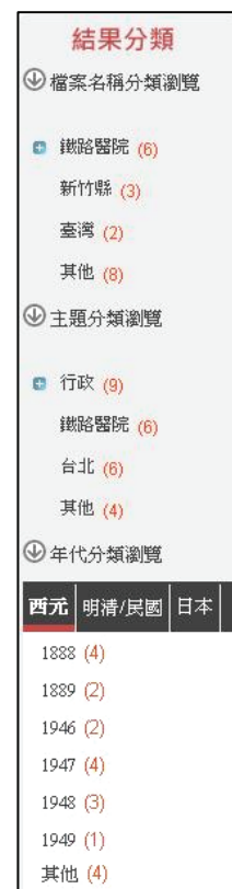
圖 11 查詢結果分類

ACROSS 提供查詢結果分類瀏覽的功能，依據「檔案名稱」、「主題」、「年代」進行分類，並在每一分類項下顯示查詢到的項目名稱及目錄筆數。在年代部分還可區分為西元、明清/民國及日本三種紀年，點按各紀年名稱，即可看到不同的紀年方式（如圖 11）。