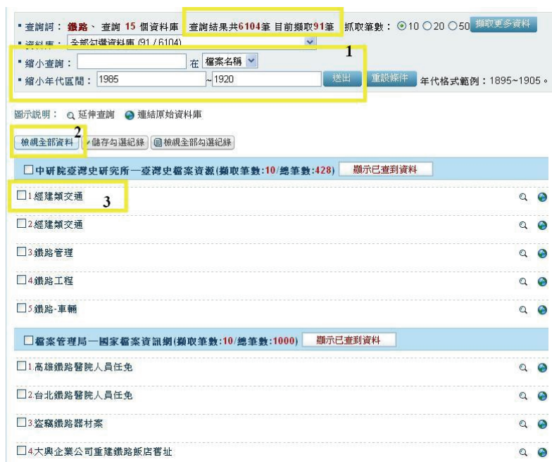
圖 5 查詢結果與縮小查詢範圍

上述查詢結果計有 6,104 筆，若要縮小查詢範圍，可在「縮小查詢」或「縮小年代區間」欄位輸入更精確的查詢詞或年代，再點按「送出」，即可限縮查詢結果。查詢結果以條列式顯示查詢到的檔案名稱，可點選「檢視全部資料」或該筆檔案目錄名稱，查看更詳細的資訊（如圖 5）。