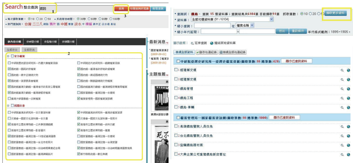
圖 4 簡易查詢與查詢結果