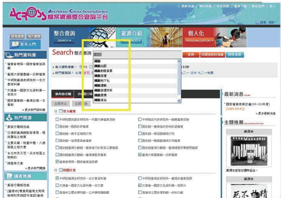
圖 7 查詢詞提示

ACROSS 根據使用者輸入的關鍵詞，提供相關查詢詞及熱門查詢詞建議功能，協助擴展查詢範圍。首先在「Search 整合查詢」欄位輸入查詢詞「鐵路」，系統會先在使用者輸入查詢詞時，出現與該查詢詞開頭相符之詞語提示 (如圖 7)。如使用者直接輸入查詢詞，點按「相關查詢詞建議」後，查詢欄位下方即會出現建議的相關查詢詞，直接點按後，即可顯示查詢結果。此外，系統也會顯示熱門查詢詞，供使用者做為查詢之參考 (如圖 8)。