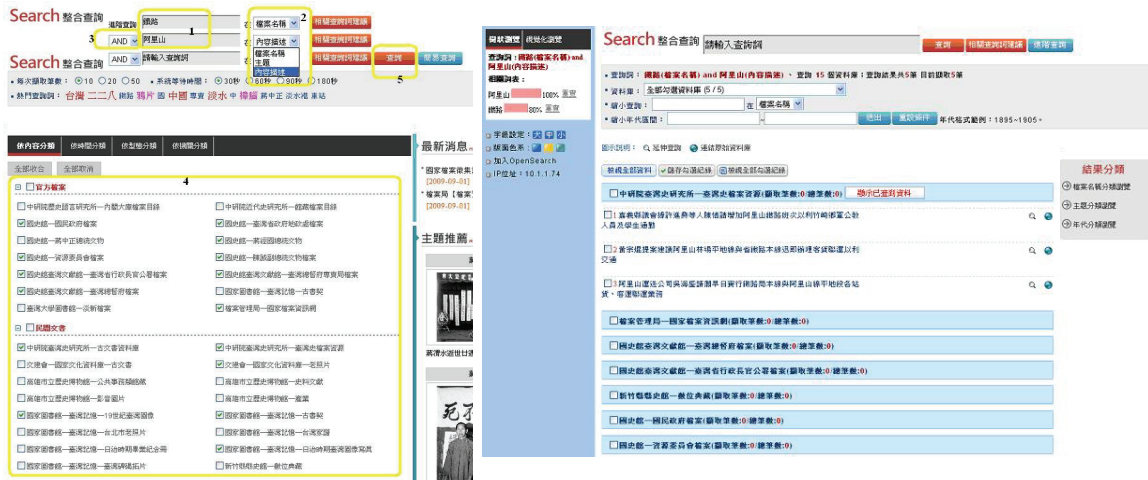
圖 6 進階查詢與查詢結果

聯集 OR、排除 NOT) 後，再勾選欲查詢的資料庫，點按「查詢」，即可產出查詢結果 (如圖 6)。