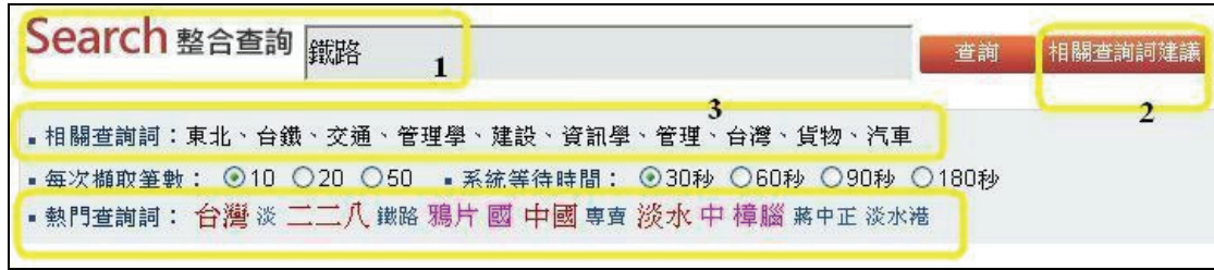
圖 8 相關查詢詞與熱門查詢詞